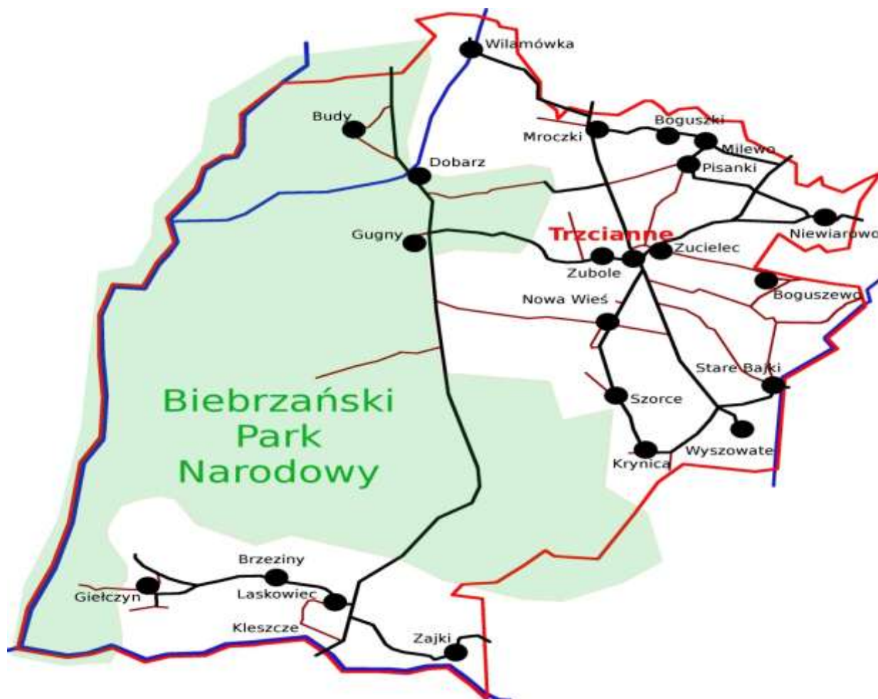
Mapa nr 5. Gminy województwa podlaskiego na terenie których znajdują się parki narodowe.